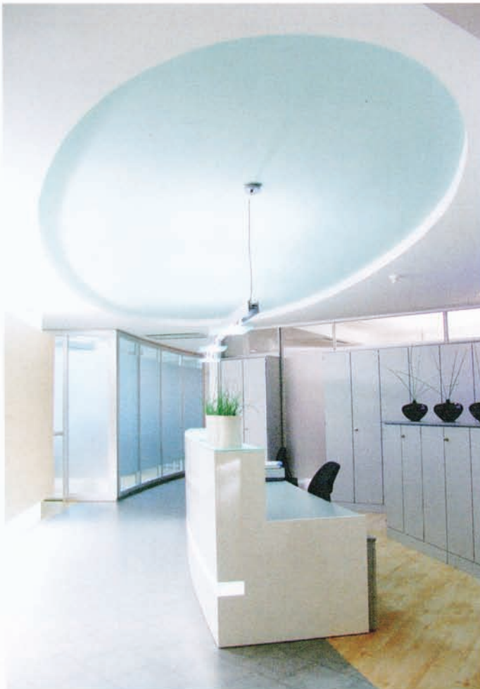
Willkommen im High-Tech-Zeitalter der Praxisgestaltung

Farbtöne Meerblau, das ebenso aus den CI-Farben der Praxis rührt, sowie Silber, das für die moderne High-Tech-Ausstattung steht und das auf der Homepage sowie der Geschäftsausstattung durch ein Logo in Form eines durch Gitterlinie dargestellten Zahnmodells aufgegriffen wird. Um nicht zu kühl zu wirken, wird das Farbkonzept durch helle, behagliche Holztöne und das frische Grün der großen Bilder in den Räumen ergänzt. Als weiteres Element zu Schaffung einer angenehmen Atmosphäre tragen sämtliche Mitarbeiter der Praxis Kleidung in einem angenehmen Rot-Ton. Darüber hinaus setzt Gutwerk ganz gezielt auf den Einsatz von Aromatherapie, um so den unangenehmen Praxisgeruch durch möglichst angenehme Düfte zu ersetzen. Im Eingangsbereich der Praxis dominiert zunächst eine große Glastür, die durch eine