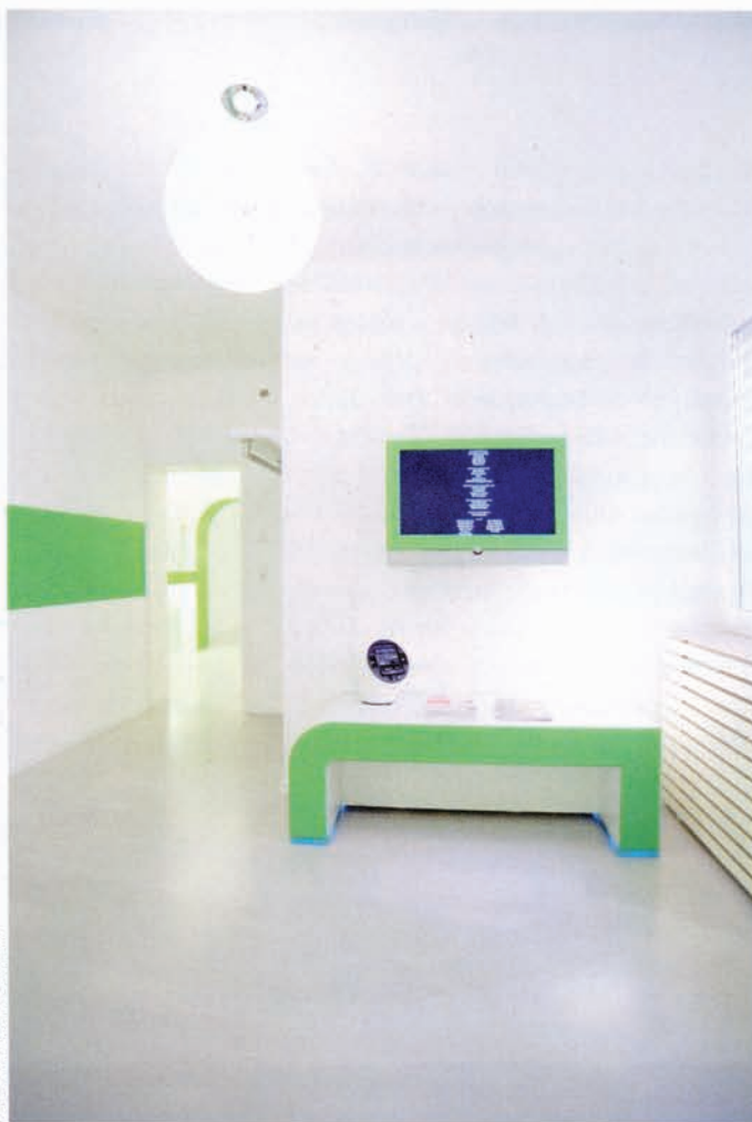
Weiß und ein dezent leuchtendes Grün wurden als Grundfarben definiert.

entwickeln, setzten die beiden Planer Rene Kottmann und Miguel Antunes insbesondere auf farbpsychologische Aspekte, um in sämtlichen Räumen eine ruhige und abwechslungsreiche Atmosphäre zu schaffen, die den Patienten Raum lässt und sie nicht einengt. In enger gemeinsamer Absprache mit dem Zahnarzt entstand schließlich ein einheitlich gestaltetes Grundkonzept mit organischen Formen in den CI-Farben weiß und grün. Das moderne Konzept betont die kundenorientierte Ausrichtung des Instituts und spiegelt gleichzeitig seine hochwertige technische Ausstattung mit hochmodernen Geräten zur digitalen Volumentomographie wider. Sämtliche Raumelemente wurden anschließend durch die Tischlerei geplant und selbst gefertigt.