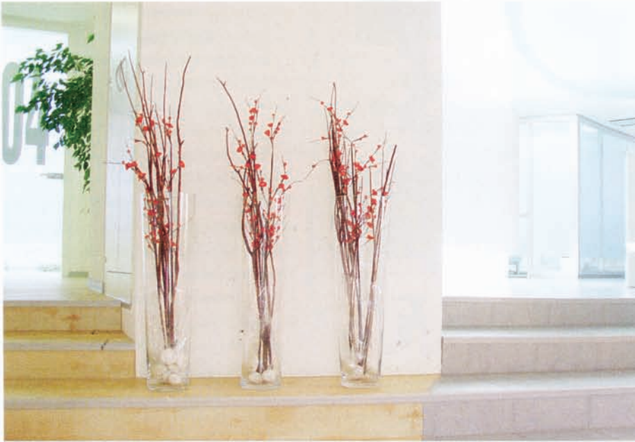
Weiß als dominante Farbe, aber mit gezielt eingesetzten Farbakzenten

Farbtöne Meerblau, das ebenso aus den CI-Farben der Praxis rührt, sowie Silber, das für die moderne High-Tech-Ausstattung steht und das auf der Homepage sowie der Geschäftsausstattung durch ein Logo in Form eines durch Gitterlinie dargestellten Zahnmodells aufgegriffen wird. Um nicht zu kühl zu wirken, wird das Farbkonzept durch helle, behagliche Holztöne und das frische Grün der großen Bilder in den Räumen ergänzt. Als weiteres Element zu Schaffung einer angenehmen Atmosphäre tragen sämtliche Mitarbeiter der Praxis Kleidung in einem angenehmen Rot-Ton. Darüber hinaus setzt Gutwerk ganz gezielt auf den Einsatz von Aromatherapie, um so den unangenehmen Praxisgeruch durch möglichst angenehme Düfte zu ersetzen. Im Eingangsbereich der Praxis dominiert zunächst eine große Glastür, die durch eine