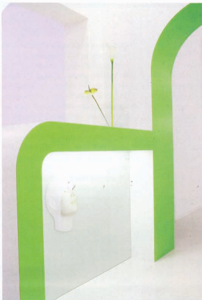
Organische Formen und eine abgestimmte Lichtgestaltung schaffen eine ruhige Atmosphäre.