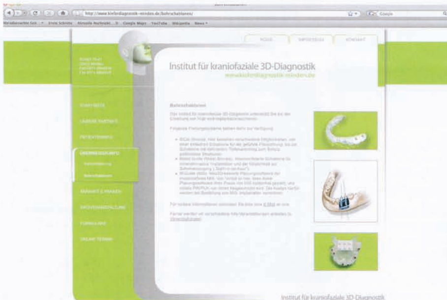
Auch im Internetauftritt setzt sich die Corporate Identity einer Praxis fort.

punkten kann, der hat im Wettbewerb um die Patienten schon fast gewonnen. Wichtig ist nur, dass die verschiedenen Aspekte auch überzeugend kommuniziert werden. Ein konsequent durchgehaltenes CI-Konzept bietet dem Zahnarzt die Möglichkeit, die unterschiedlichen Aspekte in einem einheitlichen Erscheinungsbild zusammenzufassen und so das Profil der eigenen Praxis zu stärken.