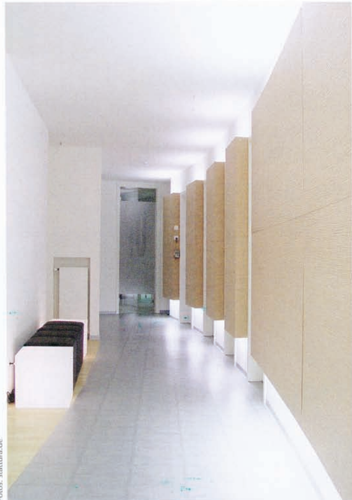
Eine farblich abgesetzte geschwungene Wand schafft Harmonie