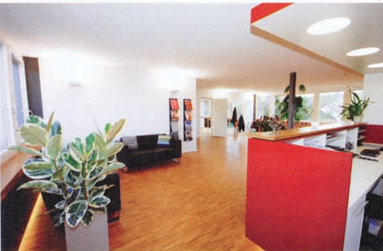
Ein Zentralmodul, das den Empfangsbereich darstellt, bildet den Kern der Praxis.

entspannend präsentieren sich auch die Behandlungsräume der Praxis: Ganz bewusst wurde hier die Behandlungszeile im Rücken der Einheiten platziert, damit die Patienten während der Behandlung die Sicht durch die großen Fensterflächen ins Freie genießen und sich bei Bedarf von den an der Decke installierten Plasma-TV-Bildschirmen ablenken lassen können. Anders als in den übrigen Räumen dominiert hier ein eher kühles Farb- und Materialkonzept. Der CI-Farbtönen Anthrazit der umlaufenden Brüstungsverkleidung wird dabei von den Polstern der Behandlungsstühle wieder aufge-